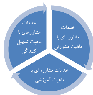
شکل ۲- انواع خدمات مشاوره ای حسابرسی داخلی از لحاظ ماهیت

خدمات حرفه ای و دانش محور که توسط نیروهای صاحب تخصص با هدف کمک به سازمان‌ها در جهت بهبود عملکرد از طریق تجزیه و تحلیل مسایل موجود و ارائه راهکار مطلوب برای حل مسایل و نارسائی‌ها و ایجاد تحول سازمانی ارائه می‌گردد. خدمات مشاوره ای بنا به درخواست متقاضی (مدیریت) صورت می‌گیرد [۵].