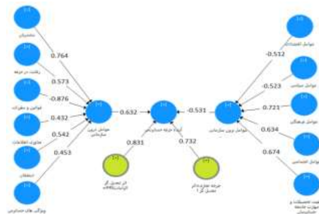
نمودار ۲: ضرایب استاندارد شده عوامل

با توجه به توجیه حضور متغیرهای مورد نظر در مدل، میزان تاثیر هر یک از متغیرهای غیر مکنون بر متغیر مکنون مربوطه مورد بررسی قرار گرفت که نتیجه این بررسی در نمودار شماره (۲) بعنوان ضرایب استاندارد شده عوامل نشان داده شده است.