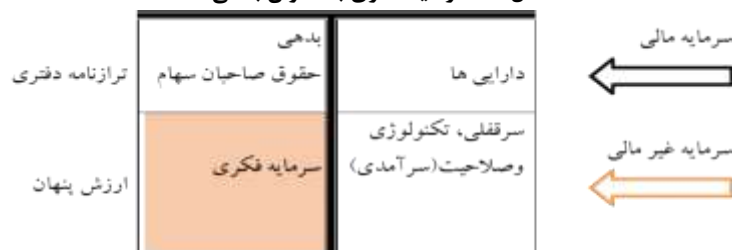
شکل (۱): سرمایه فکری به عنوان بدهی [۱۵]

به عقیده وی آنچه در ترازنامه شرکت ها درج شده است؛ سرمایه مالی و آنچه در ترازنامه درج نمی شود اما باعث ایجاد ارزش برای سازمان می شود، سرمایه غیر مالی نامیده است [۱۵]. ریاحی بلکویی سرمایه فکری را ترکیبی از سرمایه انسانی، سرمایه ساختاری و سرمایه مشتری دانست. سرمایه انسانی با دانش خود نوآوری ایجاد می کند؛ خواه محصولات و خدمات جدید باشد، یا فرایندهای تجاری را بهبود ببخشد. سرمایه ساختاری دانشی است که از نظر فن آوری، اختراعات، داده ها، نشریات، استراتژی و فرهنگ، ساختارها و سیستم ها، روال ها و رویه های سازمان به طور کلی به سازمان تعلق دارد و سرانجام، سرمایه مشتری ارزش شرکت ناشی از روابط مداوم آن با افراد یا سازمانهایی است که به فروش شرکت کمک می نماید، مانند سهم از بازار، هزینه نگهداری هر مشتری و سود هر مشتری [۲۳]. سرمایه ساختاری، به آنچه که هنگام حذف منابع انسانی و فیزیکی در یک سازمان باقی می ماند، اشاره دارد [۱۸]. سرمایه ارتباطی اشاره به سرمایه مشتری دارد. در هر کسب و کاری، مشتریان منبع اصلی تولید درآمد سازمان هستند و خشنودی و رضایتمندی آنها برای سازمانها بسیار ضروری است [۲۱].