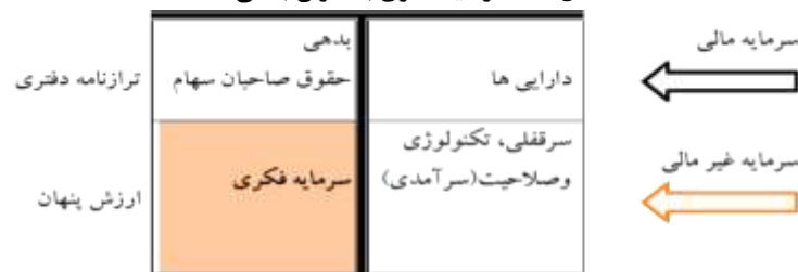
شکل (۱): سرمایه فکری به عنوان بدهی [۱۵]

به عقیده وی آنچه در ترازنامه شرکتها درج شده است؛ سرمایه مالی و آنچه در ترازنامه درج نمی شود اما باعث ایجاد ارزش برای سازمان می شود، سرمایه غیرمالی نامیده است [۱۵]. ریاحی بلکویی سرمایه فکری را ترکیبی از سرمایه انسانی، سرمایه ساختاری و سرمایه مشتری دانست. سرمایه انسانی با دانش خود نوآوری ایجاد می کند؛ خواه محصولات و خدمات جدید باشد، یا فرایندهای تجاری را بهبود ببخشد. سرمایه ساختاری دانشی است که از نظر فن آوری، اختراعات، داده ها، نشریات، استراتژی و فرهنگ، ساختارها و سیستمها، روالها و رویه های سازمان، به طور کلی به سازمان تعلق دارد و سرانجام، سرمایه مشتری ارزش شرکت ناشی از روابط مداوم آن با افراد یا سازمان هایی است که به فروش شرکت کمک می نماید، مانند سهم از بازار و سود هر مشتری [۲۳]. سرمایه ساختاری، به آنچه که هنگام حذف منابع انسانی و فیزیکی در یک سازمان باقی می ماند، اشاره دارد [۱۸]. سرمایه ارتباطی اشاره به سرمایه مشتری دارد. در هر کسب و کاری، مشتریان منبع اصلی تولید درآمد سازمان هستند و خشنودی و رضایتمندی آنها برای سازمانها بسیار ضروری است [۲۱]. به جز سه مورد فوق از برخی سرمایه های دیگر مانند سرمایه اجتماعی، سرمایه مالکیت معنوی، سرمایه فناوری و... به عنوان اجزاء سرمایه فکری نام برده شده است که تعاریف آنها در ادامه آمده است. سرمایه اجتماعی مجموعه ای از تلاش های انسان