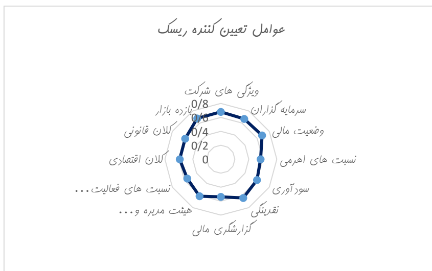
شکل ۲. اولویت بندی عوامل تعیین کننده ریسک

باتوجه به اینکه میانگین نتایج نظرات بیان شده در دو مرحله کمتر از ۰/۱ است، فرآیند نظرخواهی متوقف شده و اقدام به تحلیل نتایج براساس مقادیر بدست آمده می شود. براین اساس، متخصصان سازمانی در مورد عوامل تعیین کننده ریسک، تغییرات زیست محیطی و بازده سهام، اجماع نظر داشته و نگاه تقریبا یکسانی به مولفه ها دارند. براساس مقدار فازی‌زدایی شده رتبه و اولویت هر عامل مشخص گردید که کدام یک از متغیرها بیشترین تاثیر را دارند در شکل ۲ و ۳ به وضوح نقش هر عامل نشان داده شده است.